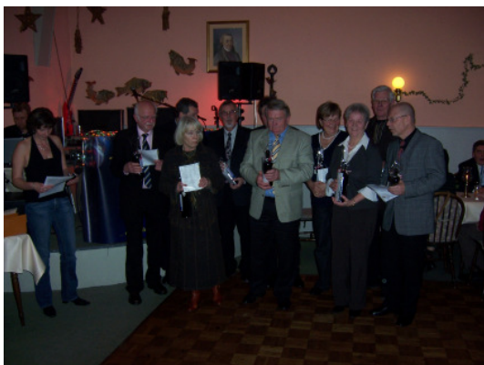
Verleihung der Urkunden im Januar beim SV Preußen