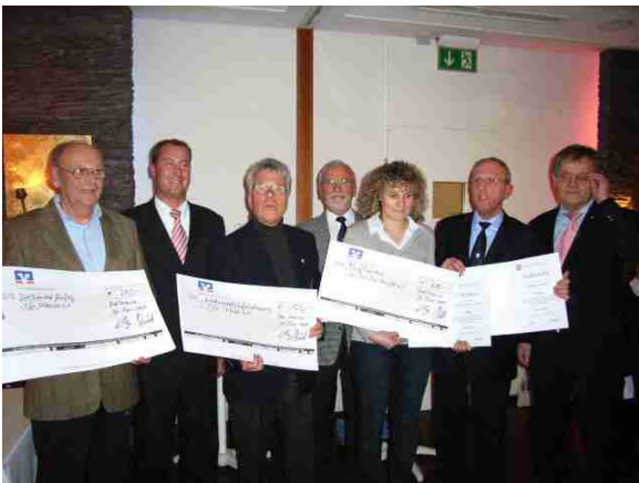
Die erfolgreichen Vereine bei der Übergabe der Schecks

Im „Sportabzeichen-Wettbewerb der Vereine“ von der Volksbank, der Raiffeisenbank eG Bargtheide und der Raiffeisenbank Südstormarn eG konnte sich der SV Preußen Reinfeld vor dem VfL Oldesloe und der TSV Trittau klar als Sieger hervorheben.