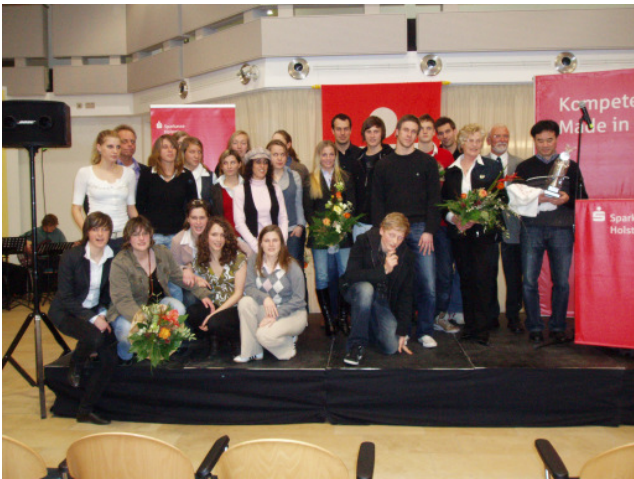
Stormarner Sportler des Jahres 2007 räumen bei den Meisterschaften ordentlich ab.