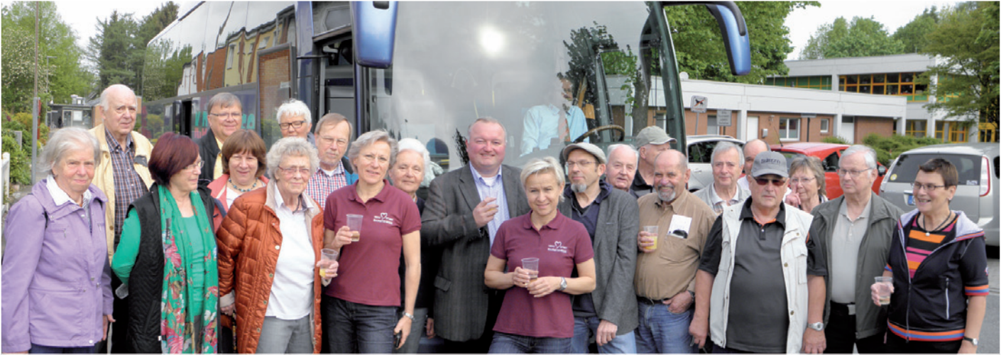
Die Verabschiedung von unserem Bürgermeister mit Sekt und Orangensaft – eine gelungene Überraschung!