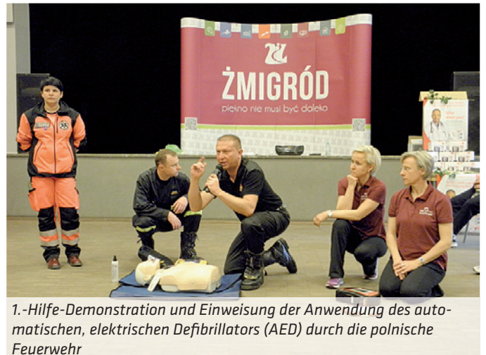
1.-Hilfe-Demonstration und Einweisung der Anwendung des automatischen, elektrischen Defibrillators (AED) durch die polnische Feuerwehr