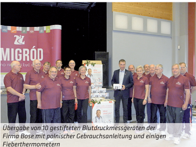
Übergabe von 10 gestifteten Blutdruckmessgeräten der Firma Bose mit polnischer Gebrauchsanleitung und einigen Fieberthermometern