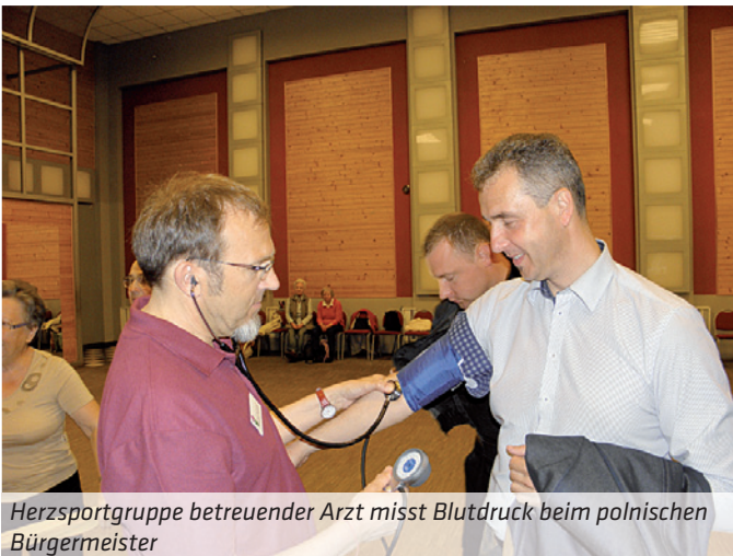
Herzsportgruppe betreuender Arzt misst Blutdruck beim polnischen Bürgermeister