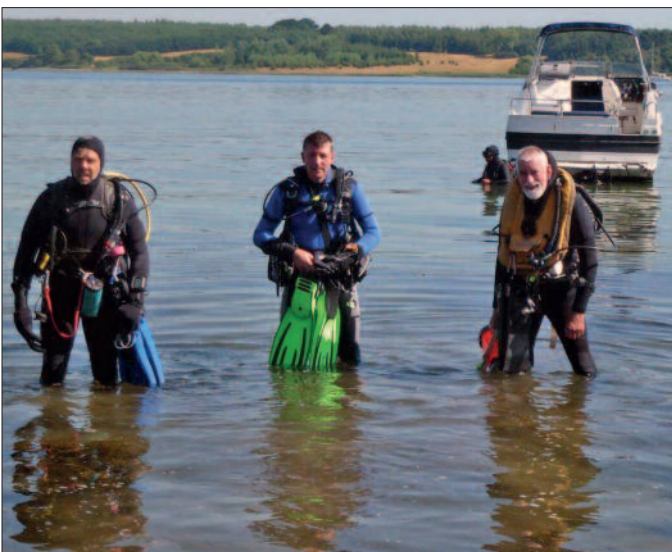
Bilder: Anja Puppke und Bernd Hirschmann (Text)

-Fauna machen den dänischen Tauchplatz so attraktiv. Das tolle Sommerwetter in diesem Jahr tat ein Übriges dazu, dass der Wohlfühlfaktor ganz groß geschrieben wurde: An der Küste bei meist leichtem Wind, Tagestemperaturen um 26° – im Wasser 22° auch in großen Tiefen. So waren täglich zwei Tauchabstiege ohne frösteln möglich. Selbst am späten Abend wurde noch in leichter Kleidung geklönt und es war die einhellige Meinung aller Aktiven: Ein optimales Tauchwochenende – spannend, erholsam und einfach nur schön.